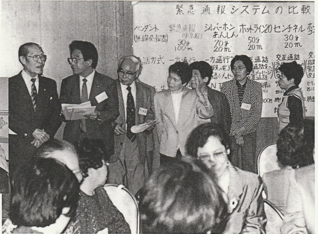
写真6 患者さん・地域住民との勉強会