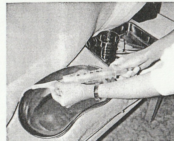
写真4 訪問看護風景