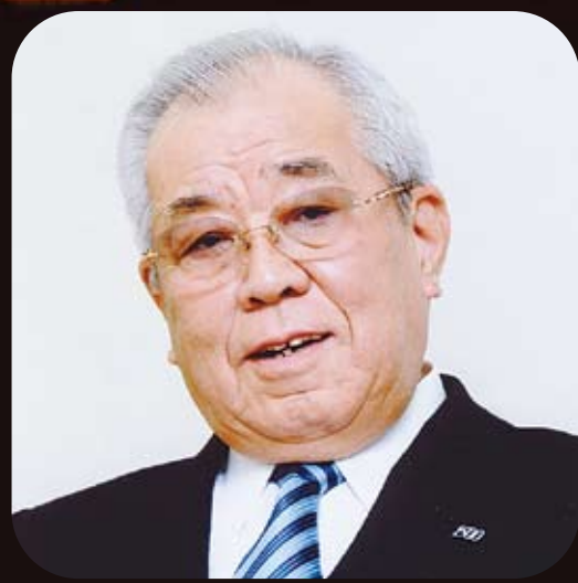
野村克也氏(京都府出身) (東北楽天ゴールデンイーグルス名誉監督)